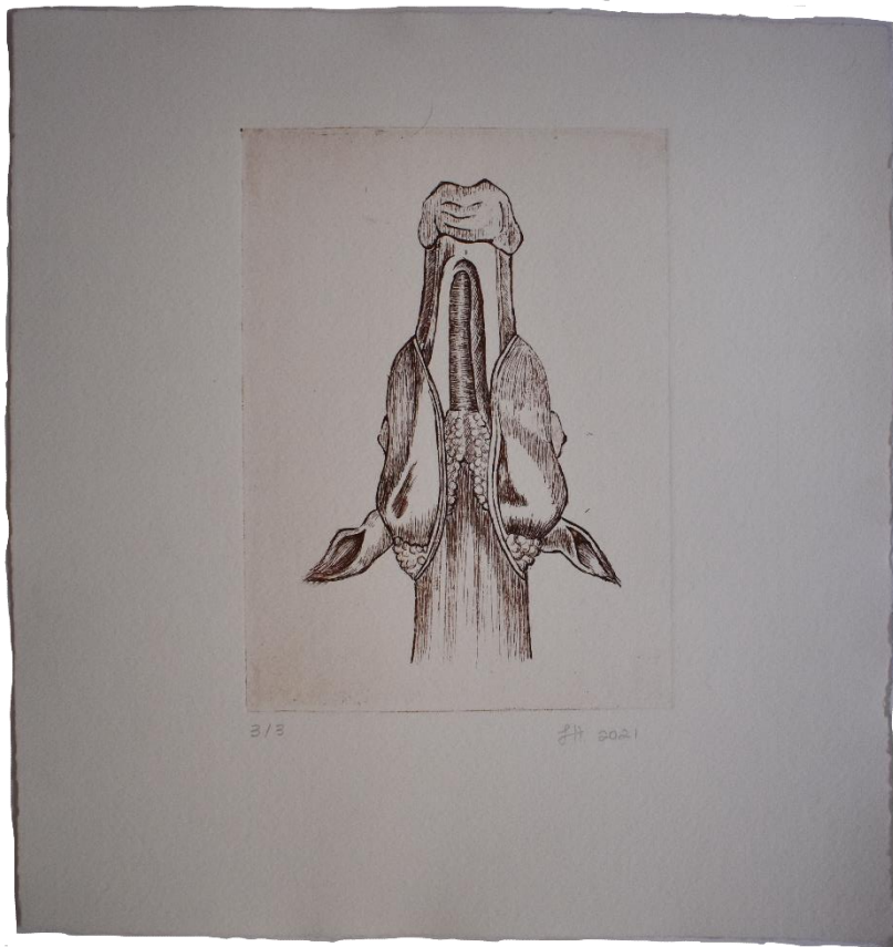
“III”, aguafuerte sobre papel Fabriano, 30 x 31.5 cm, 2021