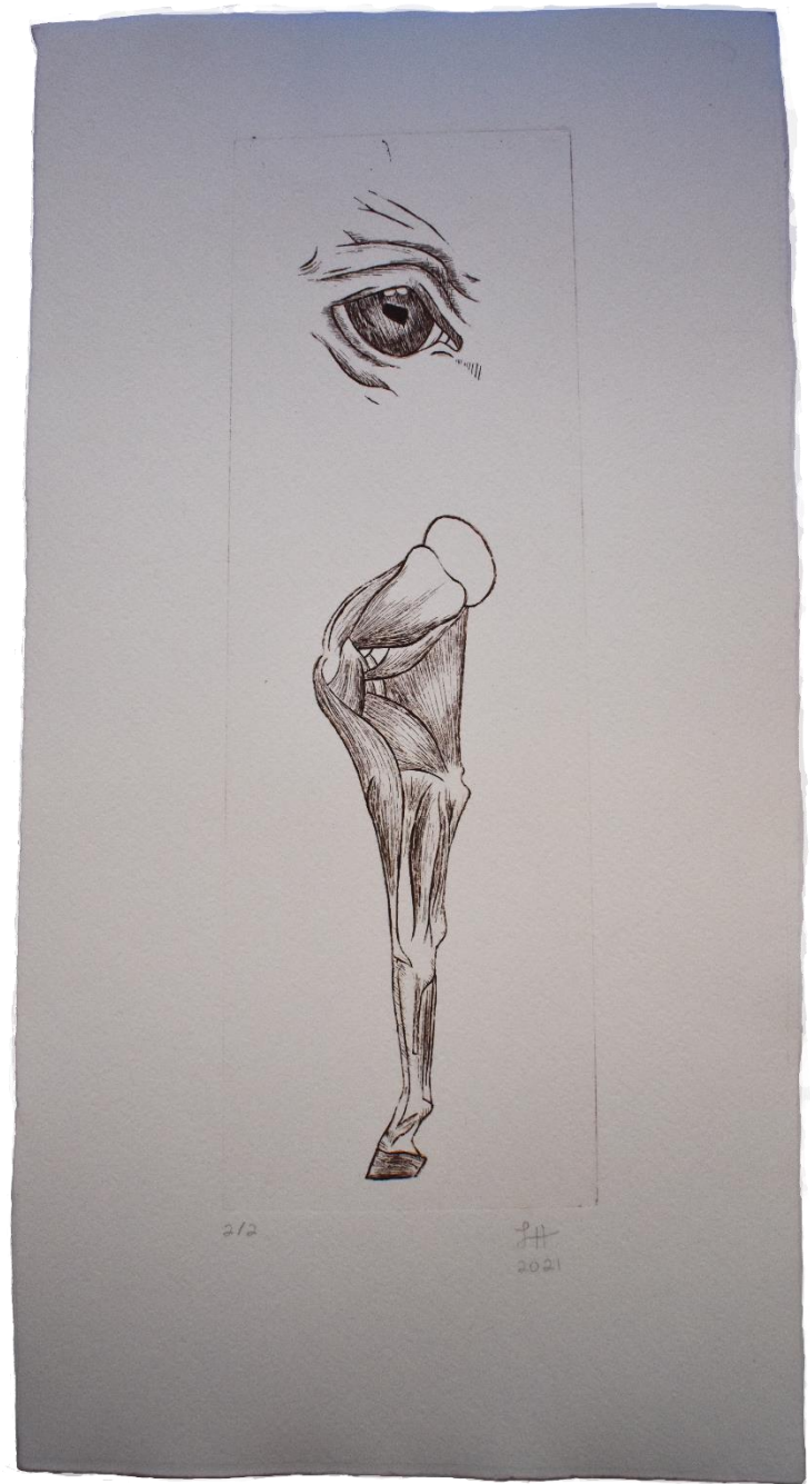
“IV”, aguafuerte sobre papel Fabriano, 23 x 44.5 cm, 2021