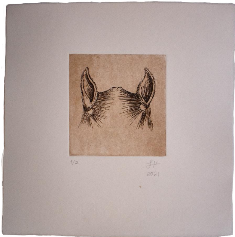
"I", aguafuerte sobre papel Fabriano, 21.8 x 22 cm, 2021