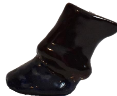
"Pata", cerámica de alta temperatura, 7.3 x 7.5 x 4.7 cm, 2021