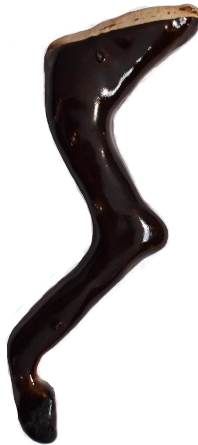
“Mano”, cerámica de alta temperatura, 8 x 13.5 x 2.4 cm, 2021