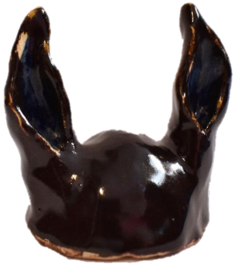
"Orejas", cerámica de alta temperatura, 7 x 6.5 x 6.5 cm, 2021