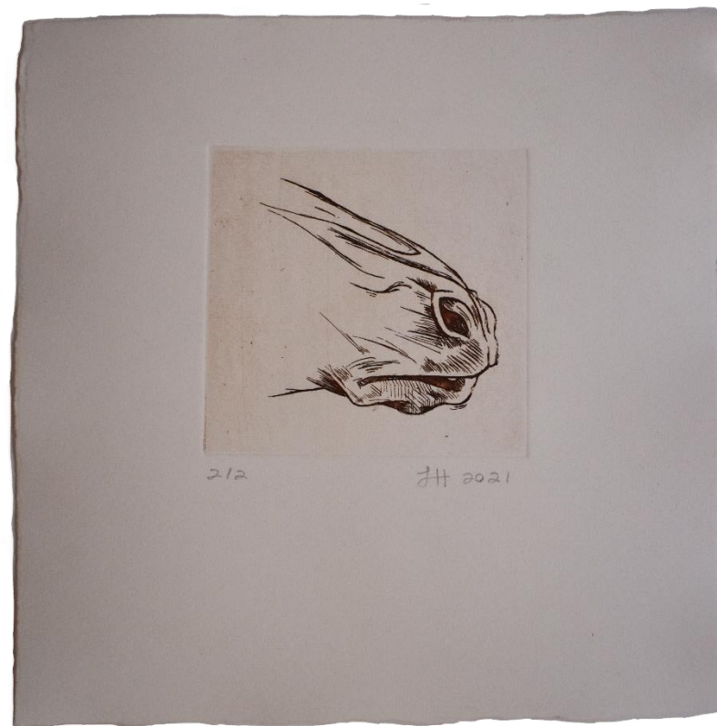
"II", aguafuerte sobre papel Fabriano, 22.3 x 22.3 cm, 2021