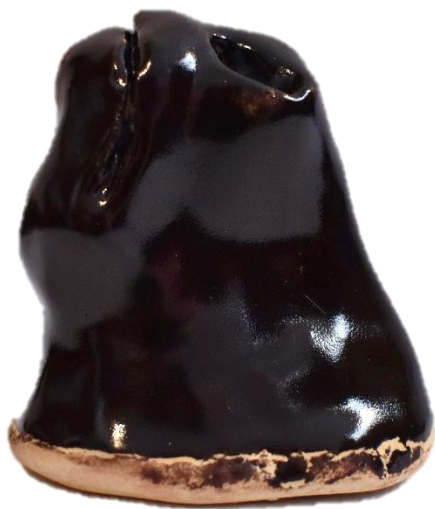
"Hocico", cerámica de alta temperatura, 5.8 x 4.4 x 6.2 cm, 2021